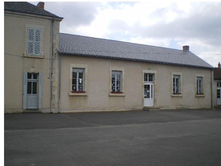
La classe de Mme Laval: PETITE ET MOYENNE SECTION

Ecole maternelle de Bouesse RPI BOUESSE-MOSNAY-TENDU