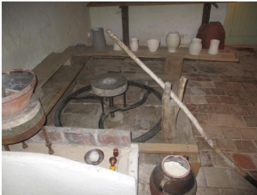
Son atelier de tournage

Dans son atelier , nous avons appris comment il travaillait.