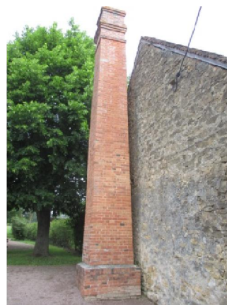
Le grand four : il monte à 1260 degrés, et cuit les pots pendant 3 jours.