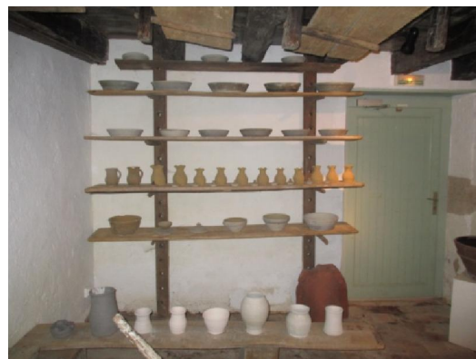
les planches pour faire sécher les poteries.